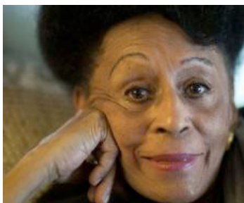
La diva de Buena Vista Social Club visitó México para ofrecer un concierto.

3 MÉXICO, D.F.— Tras la grata experiencia que tuvo Omara Portuondo con el proyecto de música infantil Reír y cantar, la diva cubana adelantó hace unos días que explorará más esa faceta poco conocida de ella y que grabará un disco homenaje al compositor mexicano Francisco Gabilondo Soler "Cri-Crí".