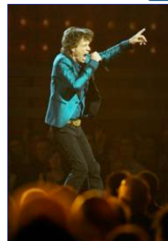
Mick Jagger sacudió la entrega de los Grammy