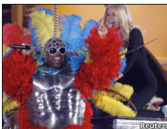
El show se lo robó Cee Lo Green acompañado de Gwyneth Paltrow y los títeres de Jim Henson.

Jagger, quien nunca había actuado en un espectáculo de los Grammy, rindió un vibrante tributo al músico del género soul, Solomon Burke.