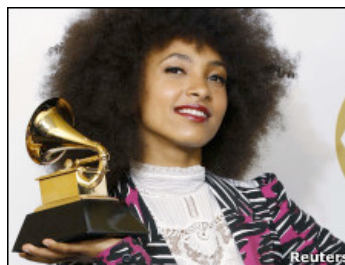
La hasta ahora desconocida Spalding se consolida al frente de la lista de los más talentosos jóvenes de EE.UU.

Tras obtener el megáfono dorado que otorga la Academia de la Música de Estados Unidos, la hasta ahora desconocida Spalding se consolida al frente de la lista de los más talentosos jóvenes del país.