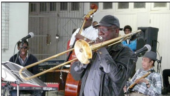
La orquesta Buena Vista Social Club durante una presentación en la Escuela Nacional de Arte de La Habana.

Es domingo en la noche en La Habana Vieja y decenas de turistas acuden a un local nocturno ubicado en la colonial Plaza Vieja de la capital cubana para escuchar la música de Buena Vista Social Club.