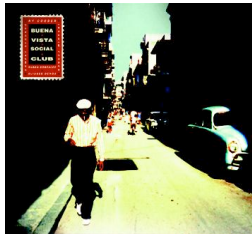
BUENA VISTA SOCIAL CLUB WCD 050

Cada uno de estos artistas tiene su propio estilo de la música cubana, y han estado poniendo sus propios sellos en el son montuno, danzones, cha cha cha, boleros y jazz cubano. Durante muchos años han afinado sus técnicas y está muy viva su pasión por la música. Este conjunto excepcional de gigantes musicales salen a los escenarios con tanta exuberancia y energía como siempre lo han hecho.