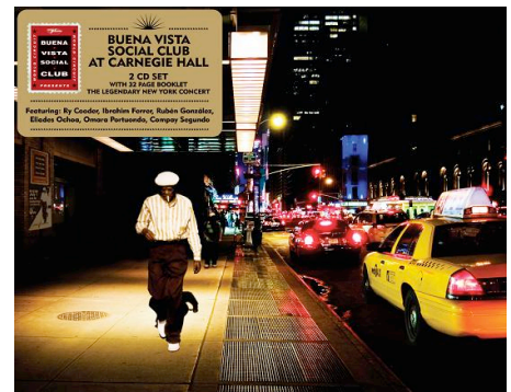
BUENA VISTA SOCIAL CLUB AT CARNEGIE HALL WCD 080